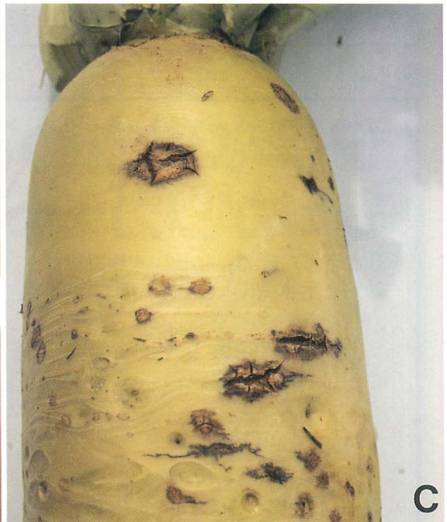
古くなったわっか症 (内部の褐変、亀裂による円形あるいは不正形褐斑)