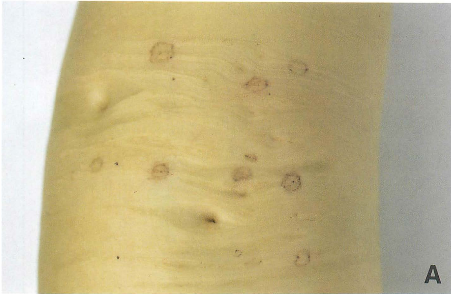
わっか症の発生様相