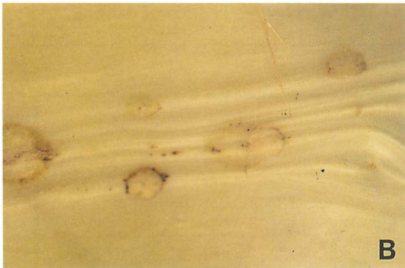
隆起状組織表面の症状