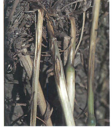
眼紋病(出穂期の症状)：尾崎政春氏原図