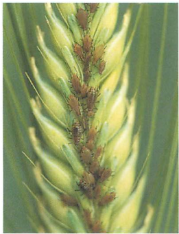
ムギヒゲナガアブラムシ ( S. akebiae )：鳥倉英得氏原図