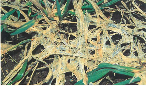
コムギ雪腐黒色小粒菌核病の病徴：清水基滋氏原図 (枯死葉上の黒い粒は、 T. ishikariensis の菌核)