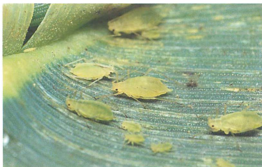
ムギウスイロアブラムシ ( M. dirhodum )：鳥倉英得氏原図