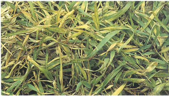
縮葉病：大藤泰雄氏原図