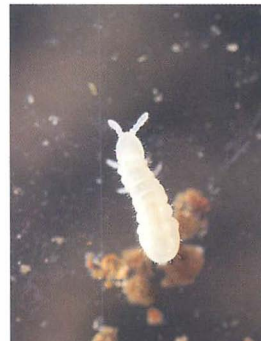
コムギを加害するシロトビムシ類：江村 薫氏原図