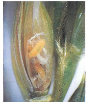
穂を加害するムギアカタマバエの幼虫：片山 順氏原図