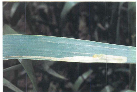
ムギクロハモグリバエ( A. albipennis )の潜葉痕：岩崎暁生氏原図