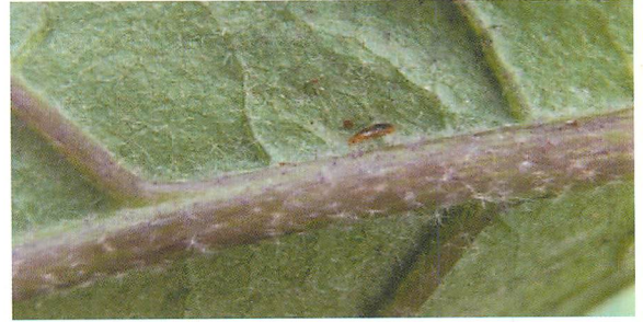
②ナス上のタイリクヒメハナカメムシ幼虫