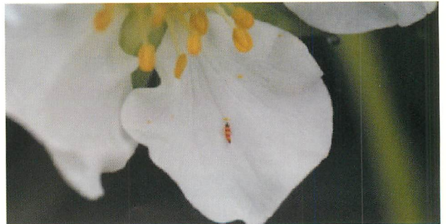
③イチゴ花上のアカメガシワクダアザミウマ幼虫