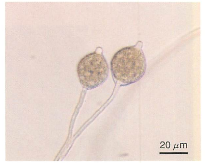
③バラ根腐病菌の胞子のう