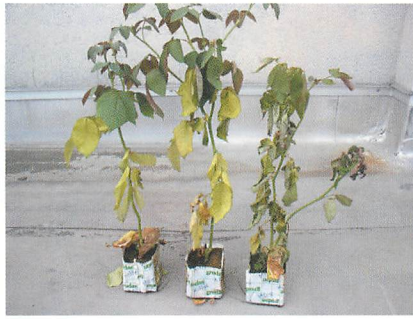
②バラ根腐病 (切りバラ)