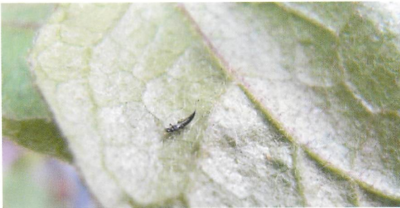
①ナス葉上のアカメガシワクダアザミウマ成虫