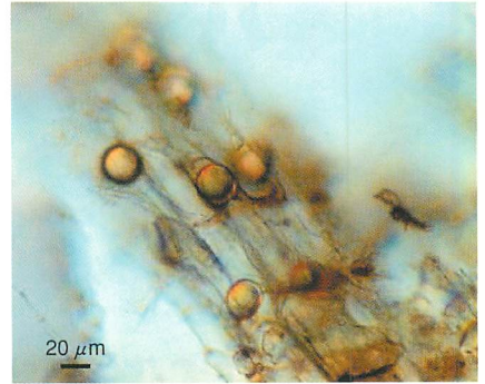
⑤根の組織中に形成された卵胞子