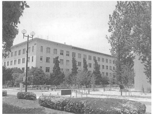
大阪府立大学 B4 棟 (生命科学部本館)。 研究室は 3 階の写真中央付近