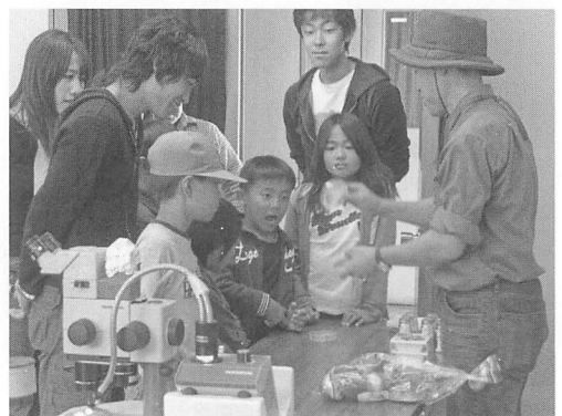
図-3 オープンキャンパスの際には子供向けの菌類観察教室も開いています(2007年11月)