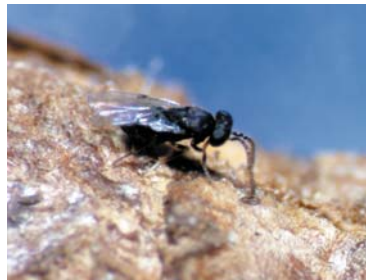
④ナナセツトビコバチ