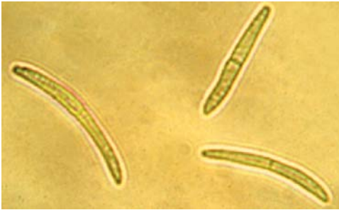
②レタス斑点病菌の分生子