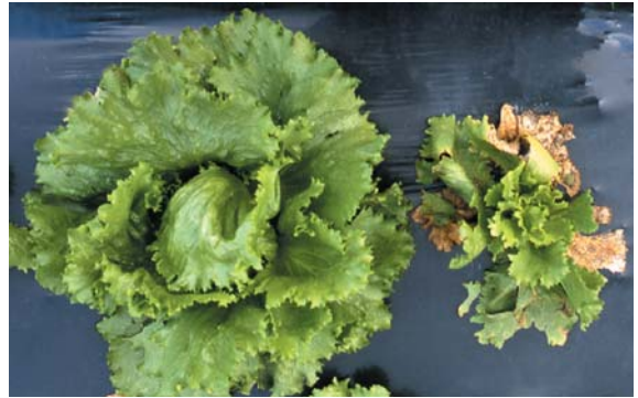
③レタス斑点病による被害 (左:健全株, 右:発病株)