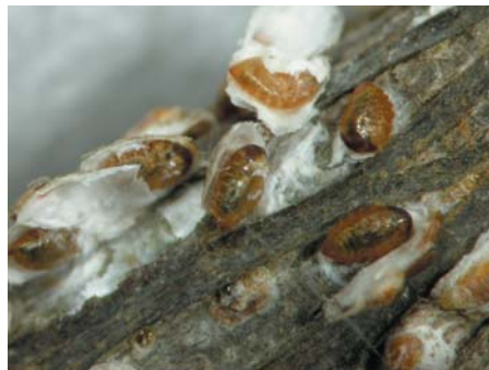
②チビトビコバチのマミー