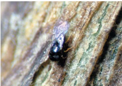
①チビトビコバチ雌成虫