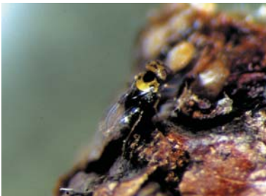
③サルメンツヤコバチ