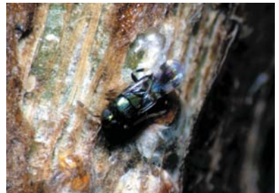
⑤クワシロミドリトビチ