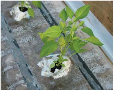
①紙包み法で定植したピーマン