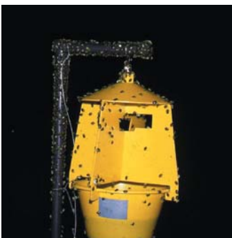
①トラップの支柱等に群がる 果樹カメムシ類