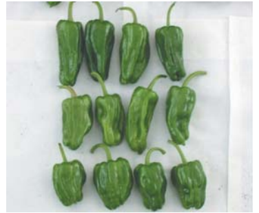
③果実の奇形 1 段正常果 2 段へこみ果, 3 段丸型果