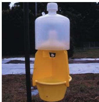
②乾式トラップ試作第 1 号