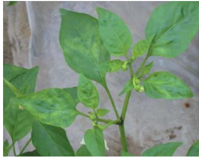
②葉のモザイク症状