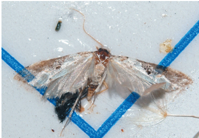
④オオモムシロシクイ