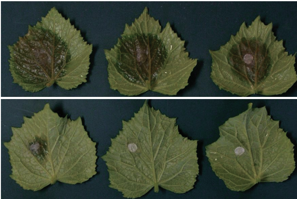
①温湯浸漬(50℃, 20 秒)によるキュウリの灰色かび病抵抗性の誘導 上：無処理, 下：温湯浸漬処理